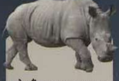
सफेद गैंडा (WHITE RHINOCEROS) ( Ceratotherium simum ) Near Threatened, about 10405 are surviving.