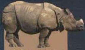
भारतीय गैंडा (INDIAN RHINOCEROS) ( Rhinoceros unicornis ) Approximate 3500 are surviving.

दुनिया में रहने वाले गैंडे की पांच प्रजातियों के नाम इस प्रकार हैं :