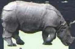
जावन गैंडा (JAVAN RHINOCEROS) ( Rhinoceros sondaicus ) About 35-44 are surviving now, Found only in Indonesia