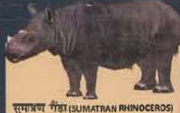
सुमात्रण गैंडा (SUMATRAH RHINOCEROS) ( Dicorhinus sumatrensis ) Fewer than 100 rhinos are believed to survive on the island of Sumatra with likely fewer than 50 animals remaining in Sabah, Malaysia