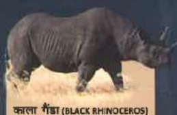
काला गैंडा (BLACK RHINOCEROS) ( Diceros bicornis ) Critically Endangered, about 5055 are surviving now.